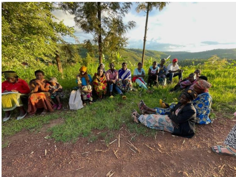
Figuur 8 - Deze groep heet Abanyamurava

De Cornerstone Foundation heeft tussen 2021 en 2023 zeven kwetsbare vrouwengroepen van RWFAT ondersteund met startkapitaal voor een doorlopend spaar- en leenfonds. Deelname aan deze groep houdt in dat ze elke week een bedrag inleggen, waarna ze kunnen lenen uit de opgebouwde spaartegoeden. Degenen die geld inleggen ontvangen rente, terwijl degenen die lenen rente betalen. RWFAT heeft deze vrouwen opgeleid volgens het goed functionerende systeem genaamd VSLA (Village Savings and Loan Associations). Dit