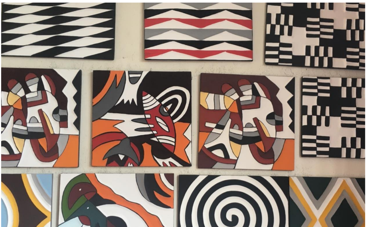
Figuur 12 - IMIGONGO lokale kunst

In Nederland werken we met een groep vrijwilligers die elke maand hun tijd en expertise inzetten. Daarnaast ontvangen we steun van zowel vaste als eenmalige donateurs en fondsen. We willen al deze mensen hartelijk bedanken voor hun bijdrage aan het verbeteren van de omstandigheden van kwetsbare jongeren in Rwanda. Dankzij uw hulp wordt de wereld een stukje rechtvaardiger.