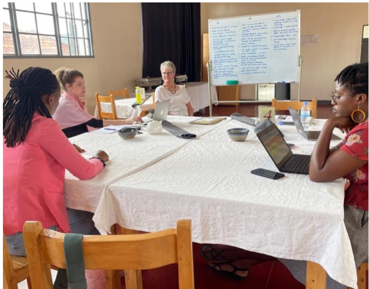
Figuur 3 - de jaarlijkse Lessons Learned bijeenkomst

(foto's/filmpjes maken, etc.) hebben we besloten dat we voorlopig niet verder gaan met de CTH. We kunnen het in de toekomst nog wel oppakken, wanneer blijkt dat het niveau Engels van de studenten is verbeterd. Deze studenten zouden wel schoolgeld moeten betalen mogelijk via een beurs, omdat CTH prijzig is. Het voordeel van onze relatie in de afgelopen 2 jaar met de CTH is dat we ons beleid, onze school (middelen etc.) en het nieuwe curriculum op internationaal niveau hebben kunnen brengen.