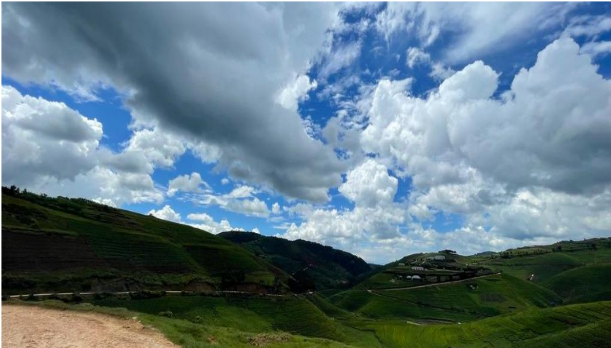
Figuur 5 Tea plantages onderweg naar Kirinda