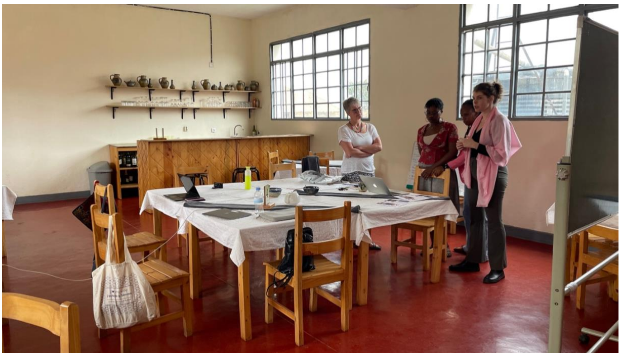
Figuur 4 - het restaurant van de school als vergaderzaal

Vorig jaar kwamen we erachter dat er een nieuw opgericht orgaan, de RTB (Rwanda TVET Board) (TVET = Technical Vocational Education and Training) bestond. Dit orgaan gaat over de TVET (MBO) programma's. We hebben in overleg met hen ons curriculum aangepast aan de vereiste kaders en bij hen ingediend. Tot onze grote verbazing was ons curriculum zonder feedback goedgekeurd en ook nog wel binnen 4 weken, wat heel uitzonderlijk is! Dit betekent dat we nu een lokale RTB-accreditatie voor ons TVET-programma hebben verkregen, wat de kwaliteit en geloofwaardigheid van onze programma's onderstreept. In de vorige jaren hadden we ook accreditatie van de Rwandese overheid, maar viel onze school onder de middelbare scholen. Omdat we vooral beroepsvakken aanbieden, past deze accreditatie beter bij ons. We zijn trots dat we hiermee de eerste school in Rwanda zijn die een voltijds TVET-programma aanbiedt!