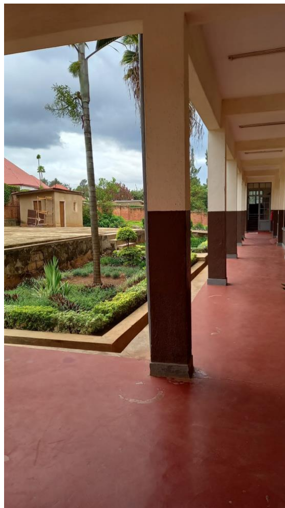
Figuur 1 Great Lakes Hospitality Institute

In 2023 verzorgden we een eenjarige opleiding voor 60 studenten, met een stage in het laatste kwartaal en hun afstuderen gepland in het voorjaar van 2024. Dit jaar begonnen we in samenwerking met Agahozo Shalom High School, een lokale middelbare school, een partnerschap opgezet om de toegang van hun afgestudeerden tot ons programma te vergemakkelijken. Deze school heeft een uniek programma omdat ze studenten in de laatste 3 jaren van de middelbare school in het Engels onderwijs