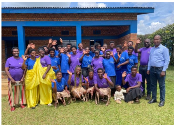
Figuur 6 - de hele groep inclusief de burgemeester, die betrokken is bij de groep